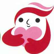
犯罪被害者等支援シンボルマーク「ギョっちゃん」