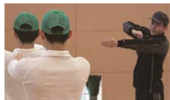
少年たちのモデルとなり、一人一人に声掛けをしながら指導していきます。