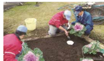
働くことの楽しさや尊厳などを教えます。少年の社会復帰に向けた大切な一歩です。