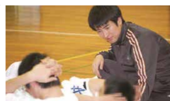
体育の時間は、少年たちも元気がいっぱい。健全な心と体を育てます。