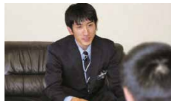
少年と1対1で真剣に向き合います。とても貴重な時間です。