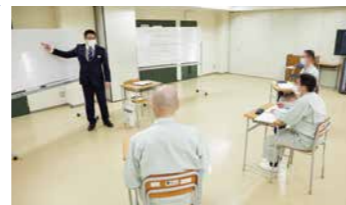
認知行動療法などの手法を取り入れたプログラムをグループワーク形式で受刑者に実施します。