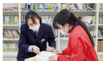
中学や高校の教科を教え、基礎学力や進路選択に必要な力を育てます。