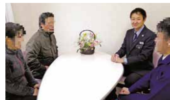
少年、保護者等と面接を行い、出院後の生活について話し合います。